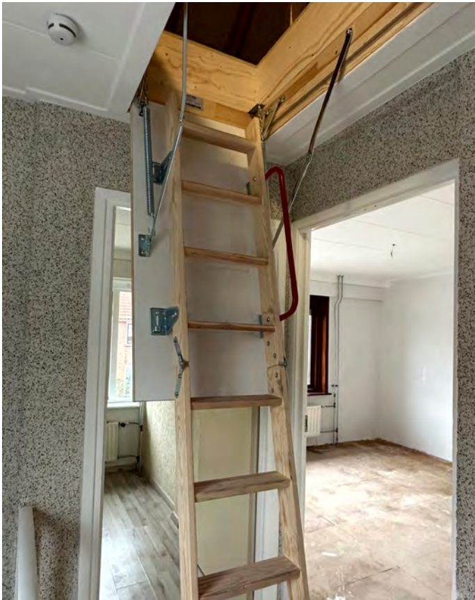
Het geïsoleerde plafond en een vlizotrap in lege woning

Met de informatie van de klankbordgroep werkt WVH het voorstel voor het isoleren van het plafond en het maken van een bergzolder verder uit. Bij lege woningen voeren we dit uit.