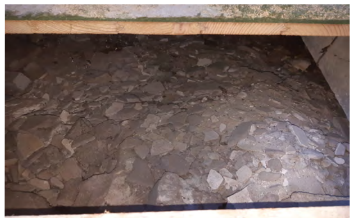
Puin onder de begane grondvloer in lege woning

De belangrijkste uitdaging waar u ook mee te maken heeft is; hoe komen we onder de vloer. Van buitenaf, via de tuin, is hoogstwaarschijnlijk niet mogelijk. Dit zou betekenen dat we via een luik in de woonkamer en de hal de isolatie onder de vloer moeten spuiten. Maar wat zijn de gevolgen als we de vloerbedekking niet makkelijk kunnen verwijderen? Dit bespraken we met de klankbordgroep.