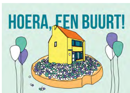
De eerste kaart van de briefkaartenactie

U krijgt dan een uitnodiging voor de volgende keer.