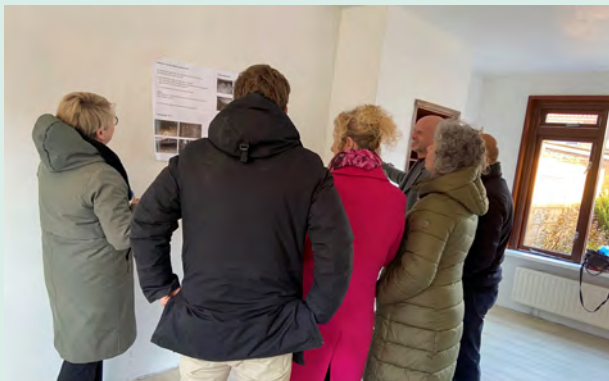
WVH-collega's bespreken de plannen in lege woning

Wij stelden u de vraag of u actief mee wilt denken. Vijftien bewoners gaven aan dit te willen in de vorm van een klankbordgroep. We zijn een paar keer bij elkaar geweest met deze bewoners. We bespraken de informatie die we bij u hebben opgehaald en vroegen welke werkzaamheden zij graag als eerste uitgevoerd zouden zien. Hier kwam uit dat zij graag willen dat WVH start met isolatie van de begane grondvloer.